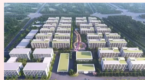
杭州钱塘健康驿站

2022 年,面对严峻复杂的国际国内不利环境形势,集团凝心聚力,踔厉奋发,实现产值再次突破百亿,参与了杭州钱塘健康驿站、亿丰时代商住楼(二期)、瑞安市高级中学教师公寓、瑞安市汀田街道社区卫生服务中心、华润杭州城北二期二期购物中心(万象城)等多个公建项目、重点项目建设。所属杭安公司优化项目品类,实现逆势增长;所属杭构集团积极应对大幅萎缩的杭州商品砼市场,实现产能提升。