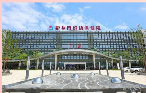
杭安公司衢州市妇幼保健院项目荣获“中国安装之星”

春华秋实,岁物丰成。在大家的奋进中,这一年收获满满。在“2022 浙商全国 500 强”榜单上,集团成功上榜,位列第 159 位,并荣获全国工程建设企业信用等级 20 星、中国工程建设 AAA 级信用企业、浙江省建筑产业工人队伍培育先行企业等荣誉。在创优夺杯上,杭安公司衢州市妇幼保健院项目荣获“中国安装之星”,集团杭政工出[2020]9 号计算机、通信和其他电子设备制造业项目获“2022 年度浙江省智慧工地示范项目”称号,三个项目荣获“浙江省优秀安装质量奖”。在技术创新上,共获得 4 项发明专利,13 项实用新型专利,5 项省级工法。